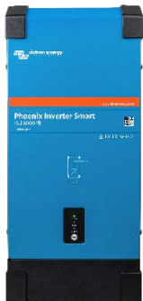
Inverter Phoenix Smart 12/2000